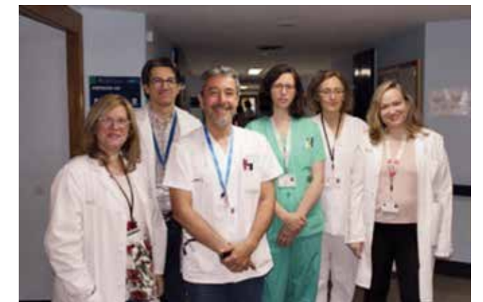
Integrantes del Equipo del Programa de Optimización de Antimicrobianos Hospitalario (PROA)

1.- Global burden of bacterial antimicrobial resistance 1990–2021: a systematic analysis with forecasts to 2050. www.thelancet.com. Published online September 16, 2024 doi: 10.1016/S0140-6736(24)01867-1.