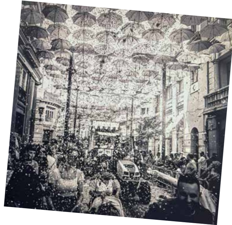
1er. Premio de Fotografía