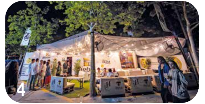
4 De la Carpa a la Carrera. La teoría del empujoncito

Redacción: Mercedes Martínez Rubio Imprime: Servicios y Manipulados ALBA, S.L.U. Dep. Legal AB-521-2001