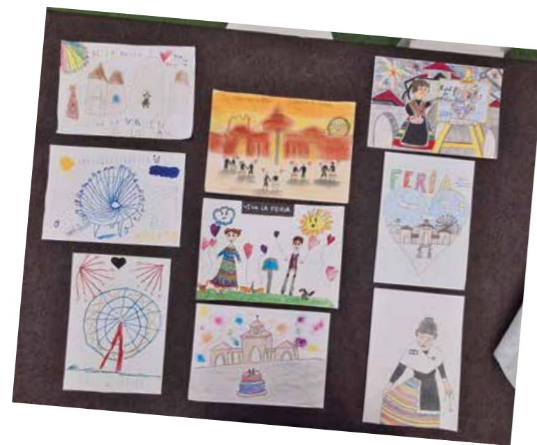
Imágenes de los carteles ganadores del Concurso