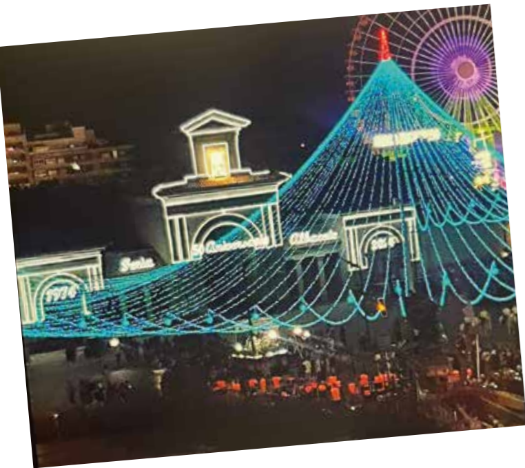
2.º Premio de Fotografía