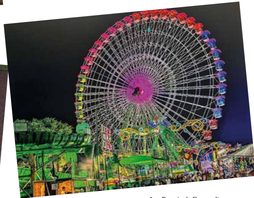
3er. Premio de Fotografía