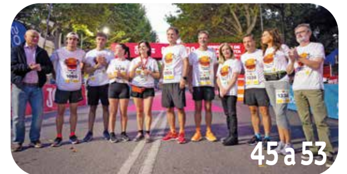
45a53 5K Corre con tu médic@

El Ilustre Colegio de Médicos no comparte necesariamente las opiniones vertidas en esta revista. Se autoriza la reproducción total o parcial de los contenidos citando la fuente. En cumplimiento de lo establecido en el RGPD, le informamos que sus datos proceden de los ficheros responsabilidad de Colegio Oficial de Médicos de Albacete, con la finalidad del mantenimiento y cumplimiento de la relación entidad-colegiado y prestación de servicios derivada de la misma, incluyendo el envío de comunicaciones informativas, comerciales y de cortesía en el marco de la citada relación. Así mismo, sus datos serán cedidos en todos aquellos casos en que sea necesario para el desarrollo, cumplimiento y control de la relación entidad-cliente y prestación de servicios derivada de la misma o en los supuestos en que lo autorice una norma con rango de ley. En cumplimiento del RGPD puede ejercitar sus derechos ante Colegio Oficial de Médicos de Albacete, con dirección en Plaza Altozano, 11, 2001 - ALBACETE, adjuntando fotocopia de su DNI.