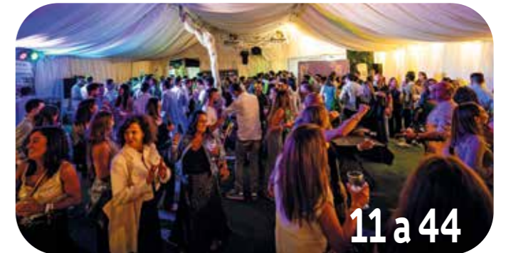
11a44 Actividades en la Carpa de la Feria