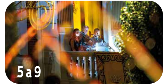
5a9 Pregón de Feria